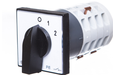
Zmiana liczby obrotów - Rozłącznik w układzie Dahlandera (2biegi O-D-YY)