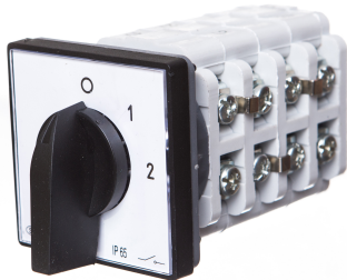
Zmiana liczby obrotów - Rozłącznik w układzie Dahlandera (2biegi O-D-YY)