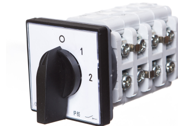
Zmiana liczby obrotów - Rozłącznik w układzie Dahlandera (2biegi O-D-YY)