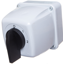
Zmiana liczby obrotów - Rozłącznik w układzie Dahlandera (Zbiegi O-D-YY)