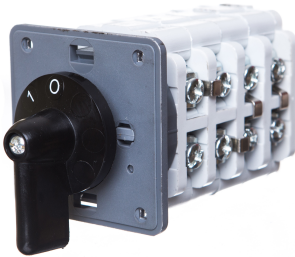
Zmiana liczby obrotów - Rozłącznik w układzie Dahlandera (2biegi O-D-YY)