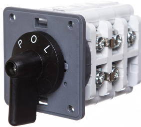
Zmiana liczby obrotów - Rozłącznik w układzie Dahlandera (2biegi O-D-YY)