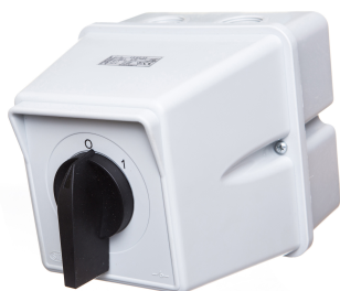
Rozłącznik 3 faz O-I