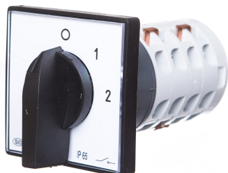
Zmiana liczby obrotów - Rozłącznik w układzie Dahlandera (2biegi O-D-YY)