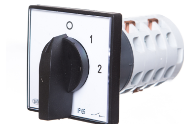
Zmiana liczby obrotów - Rozłącznik w układzie Dahlandera (2biegi O-D-YY)