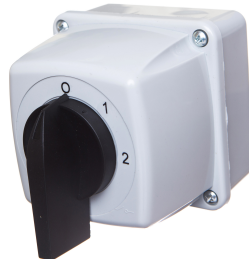
Zmiana liczby obrotów - Rozłącznik w układzie Dahlandera (2biegi O-D-YY)